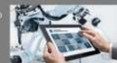
DIGITALIZACIJA IN NOVE TEHNOLOGIJE ZA VIŠJO KONKURENČNOST