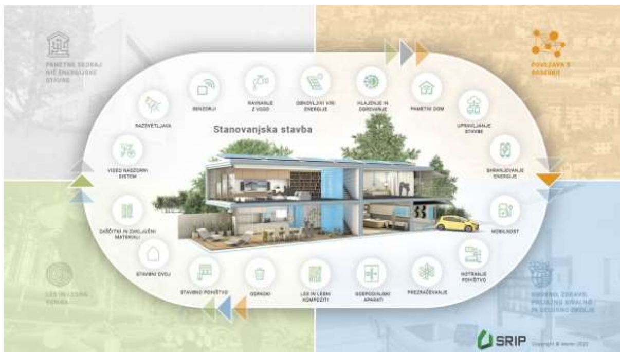
Slika: Pametna in trajnostna družinska stanovanjska stavba ter nanjo navezujoča napredna infrastruktura