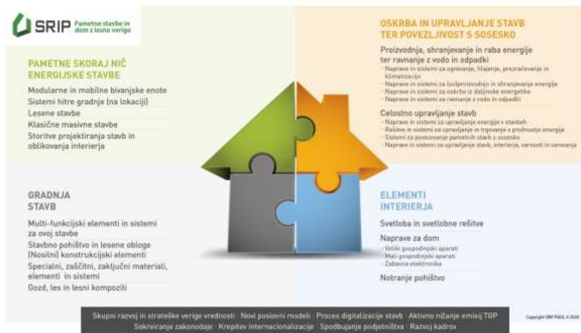
Slika: Fokusna področja in produktne smeri prenovljenega AN SRIP PSIDL 2020 - 2023

Ta so zaznana na različnih področjih delovanja in so posledica zaznanih tehnoloških in družbenih trendov, kadrovskega potreb na trgu in zakonodajnih ter okoljevarstvenih izzivov: skupni razvoj in strateške verige vrednosti, novi poslovni modeli, proces digitalizacije stavb, aktivno nižanje emisij TGP, sokreiranje zakonodaje, krepitev internacionalizacije, spodbujanje podjetništva in razvoj kadrov . Za horizontalna in skupna področja delovanja je značilno, da po svoji vsebini presegajo področja posameznih produktivnih smeri in fokusnih področij. Nemalokrat so te vsebine lastne več SRIP-om (seveda s svojstvenim pridihom).