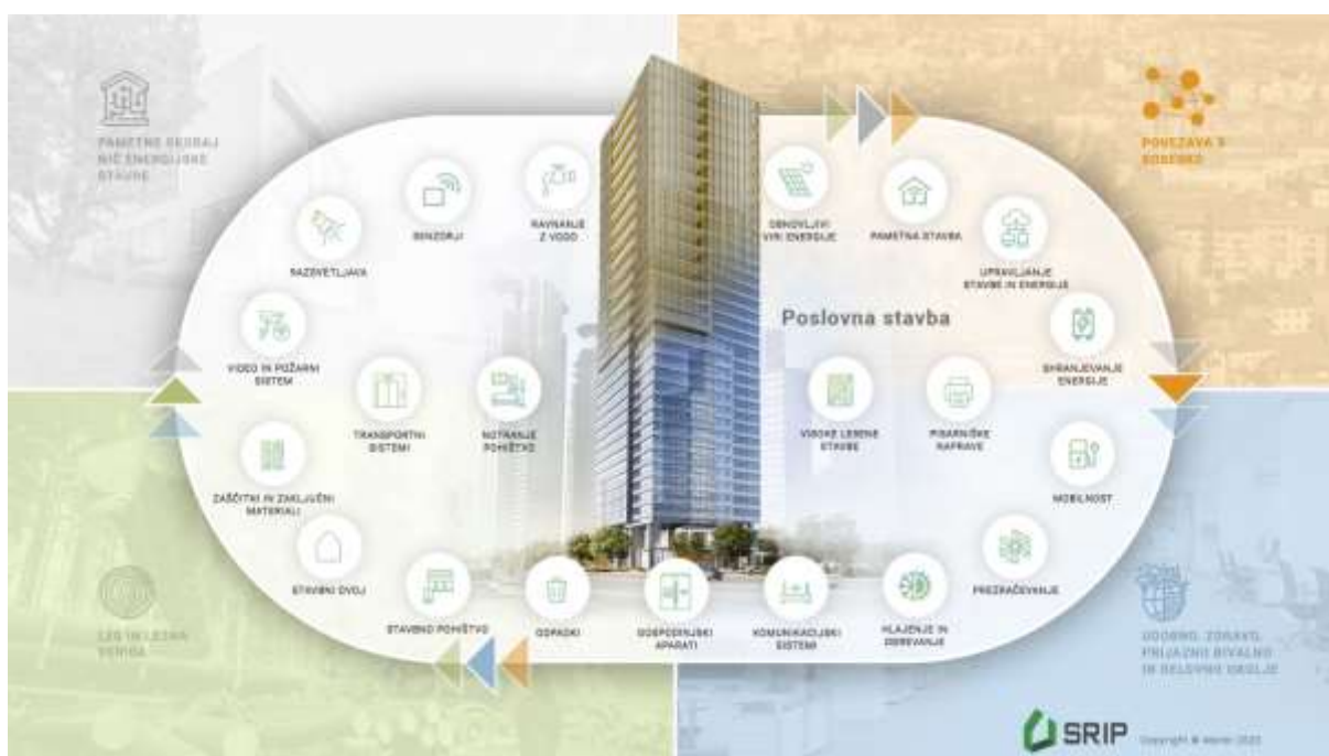
Slika: Pametna in trajnostna poslovna stavba, tudi visoka lesena, ter nanjo navezujoča napredna infrastruktura