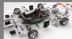
ZELENI MODELI IN PRISTOPI